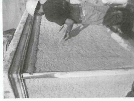
Colocación de cinteado para repello