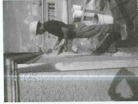
Integración de Ensabietado