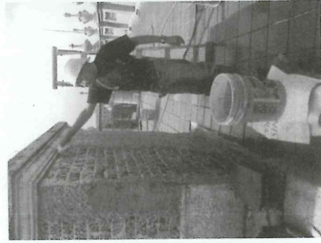
Liberación de Repello