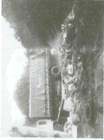
Lugar del Tiradero de Ripio