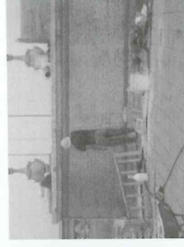
Integración de repellos

Proceso de la Integración de Acabados finales en los muros del cubo de gradas del Torreón Central